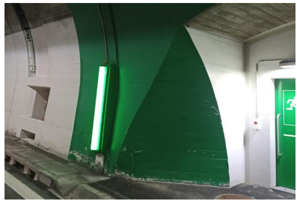
Paramento e cunicolo trasversale Piottino NS