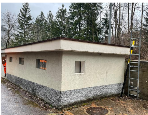
Vista dell'opera di presa sul riale Foch