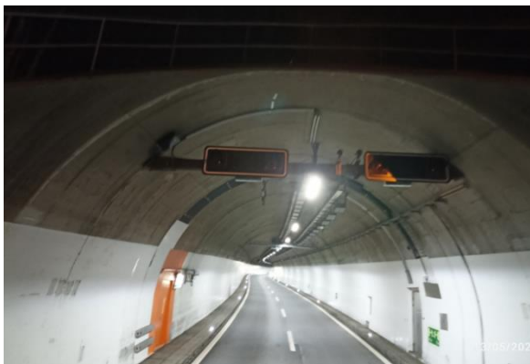
Portale galleria Pardorea NS

Nei mesi di maggio e settembre sono state svolte le ispezioni nella direzione NS e SN delle gallerie del Piottino: Piottino, Pardorea, Casletto e Piumogna, compreso l'acquedotto antiincendio e la relativa opera di presa.