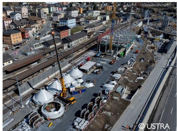
Airolo – Impianto di trasbordo e area installazioni