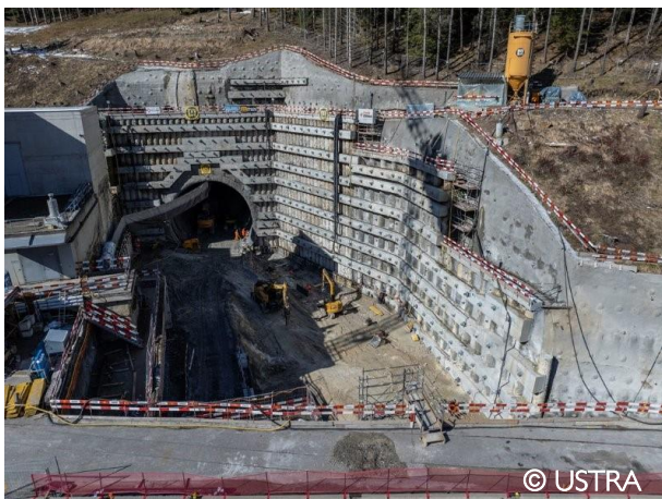
Airolo - Trincea di approccio 2TG