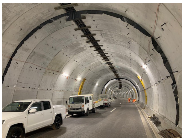
Vista d'insieme del controanello prima del getto in volta

Cogliamo l'occasione di questo importante traguardo per ringraziare le imprese esecutrici dei lavori (Pizzarotti SA e Kummler+Matter SA), la Direzione Lavori e il Progettista (Consorzio TiLume: Lombardi SA, Pini Group SA, Afry Svizzera SA), come pure il Committente (USTRA – Ufficio Federale delle Strade).