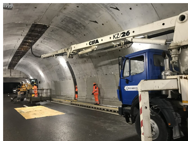
Completamento del getto del controanello