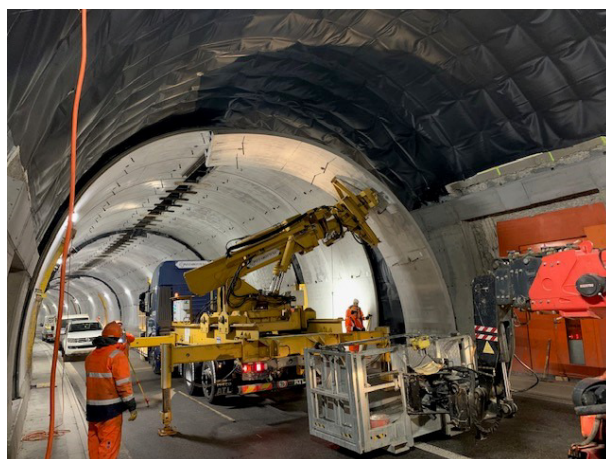
Posa del controanello in corrispondenza delle nicchie SoS