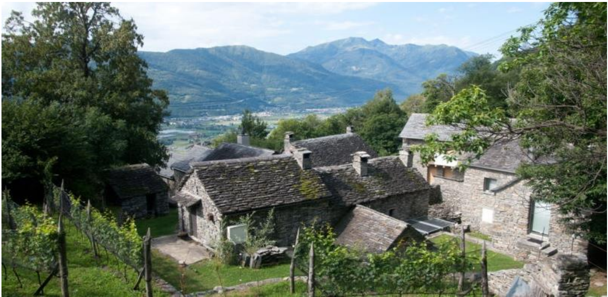
Ristorante e Ostello di Curzútt

La Filippini & Partner Ingegneria SA è lieta di essere fra gli sponsor principali del giubileo d'argento e con l'occasione porge alla Fondazione uno speciale augurio di Buon Compleanno!