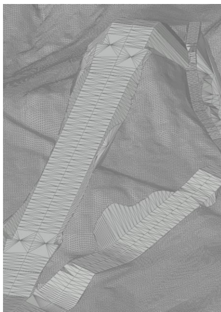
Civil3D © F&P