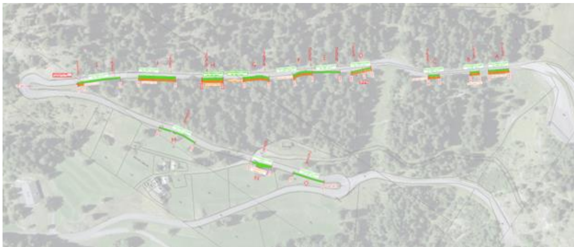
Figura 1: Visione d'insieme dell'area d'intervento