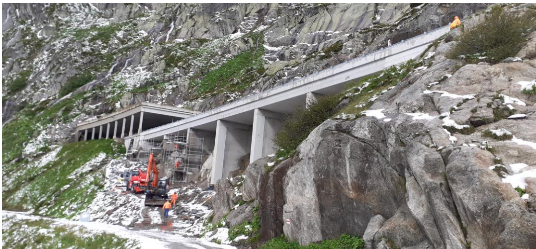
Viadotto Banchi, risanamento pile

Ci apprestiamo ad iniziare questa seconda parte dell'incarico con grande entusiasmo, e con lo stesso impegno che abbiamo riservato al progetto negli ultimi dieci anni.