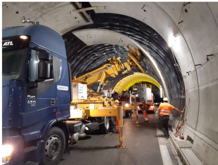
Vista del completamento del nuovo controanello

Le attività svolte in quasi 2 anni hanno visto su buona parte della galleria l'innovativa posa di lastre prefabbricate in calcestruzzo armato a protezione della carreggiata, così da consentire la tempestiva riapertura diurna al traffico dell'importante asse autostradale ticinese tra Mendrisio e Lugano, e il successivo getto integrativo con calcestruzzo auto compattante. La restante parte della galleria, dove lo stato del rivestimento lo permetteva, è stata protetta con la posa di reti in acciaio inossidabile ancorate. Sull'intera lunghezza sono infine stati realizzati dei drenaggi radiali per ridurre la pressione dell'acqua sul rivestimento.