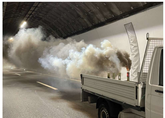
Test dei ventilatori