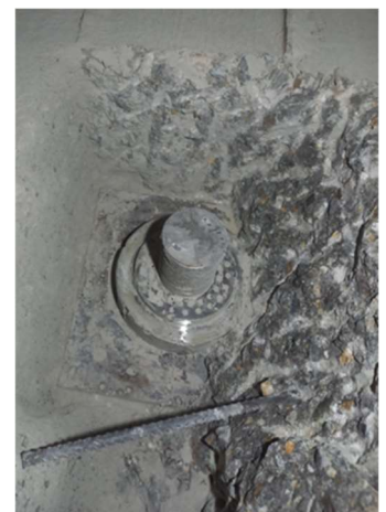
Prove di tesatura e stacco degli ancoraggi della parete di sostegno del viadotto Pianturino e scopertura di uno degli ancoraggi del viadotto Sasselli per l'esecuzione delle prove di stacco