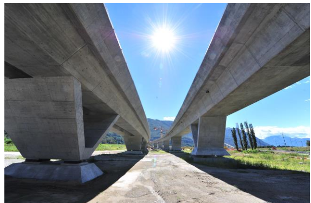
Viadotti principali, Nodo di Camorino