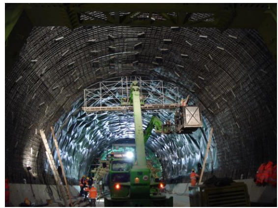
Galleria Monte Olimpino 2, Como (I)