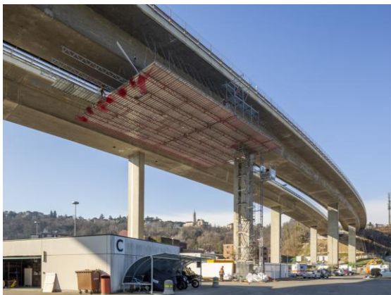
Viadotto Fornaci, Autostrada N2 Airolo-Chiasso