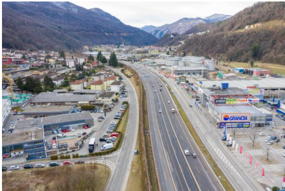
N2 EP19 Melide – Gentilino – Tratta a cielo aperto