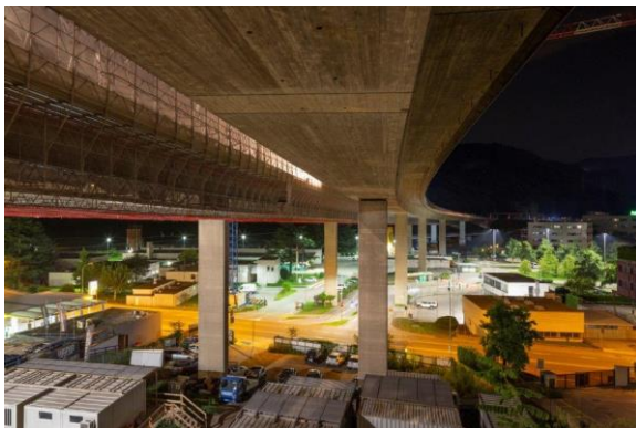
Particolare delle lavorazioni con ponteggio rampante – Viadotto delle Fomaci