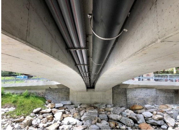
Vista del ponte dal fiume