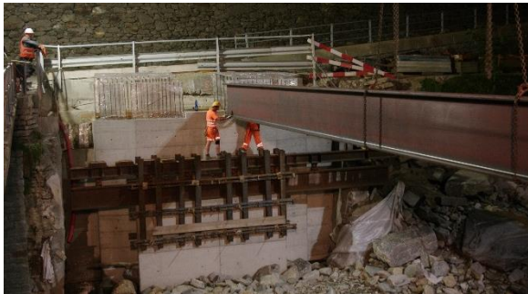
Montaggio centina (HEB 1'000 - L 23.30m)