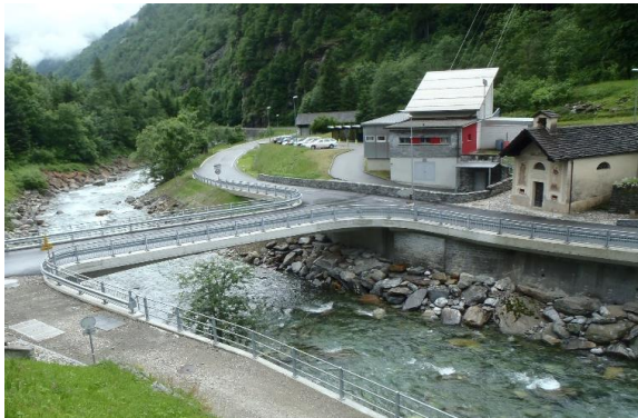
Panoramica del ponte