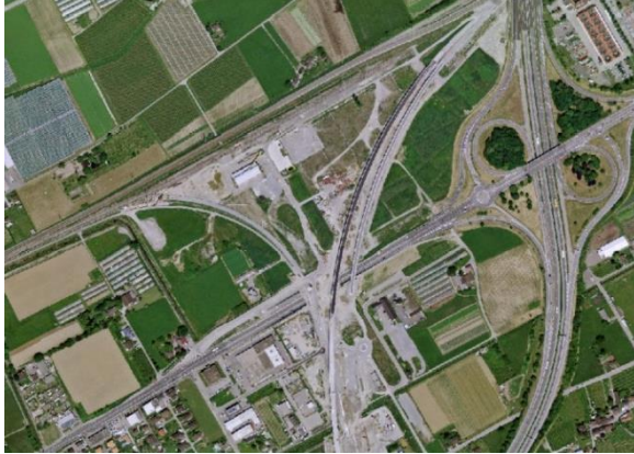
Vista satellitare Nodo di Camorino