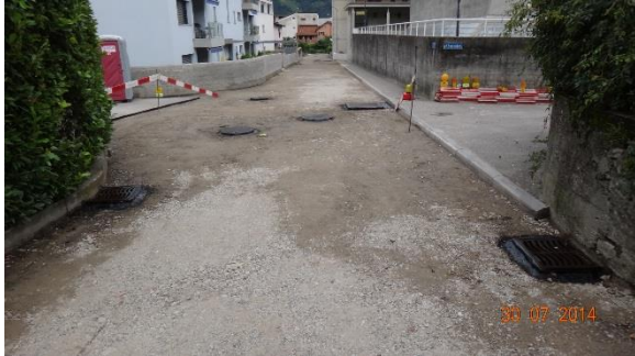
Sistemazioni stradali via Cuvènt in completazione