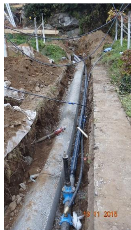
Realizzazione nuove infrastrutture AMB e nuovo collettore acqua potabile Serbatoio al Gaggio