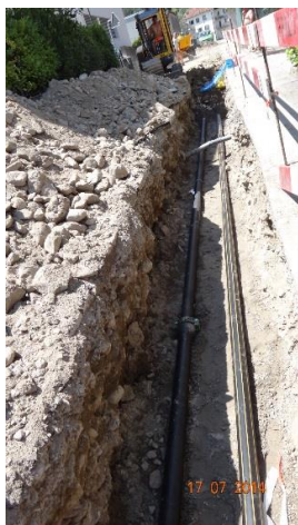
Realizzazione nuove condotte GAS e sostituzione condotte acqua potabile Via Cuvènt