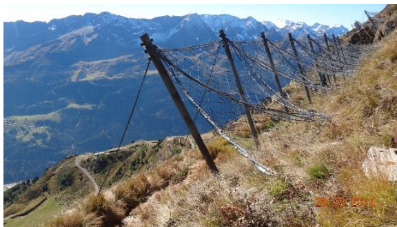
Reti da neve Alpe Pontino-Airolo