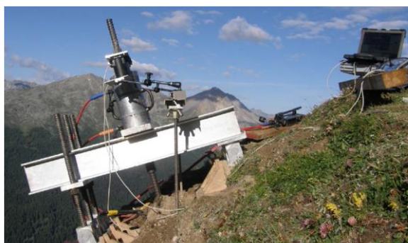
Prove di ancoraggio a bassa energia degli ancoraggi

Committente: Consorzio ripari e premunizioni sopra Airolo