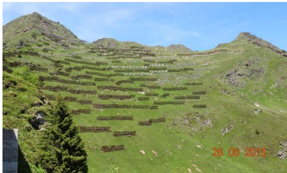
Ripari valangari Alpe Pontino-Airolo, zone A-B-C