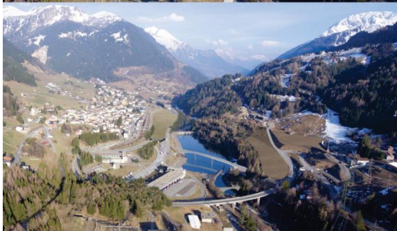
Riordino dello svincolo di Airolo: stato attuale (in alto) e stato di progetto (in basso) [Arch. G. Guscelli, Ambrì]