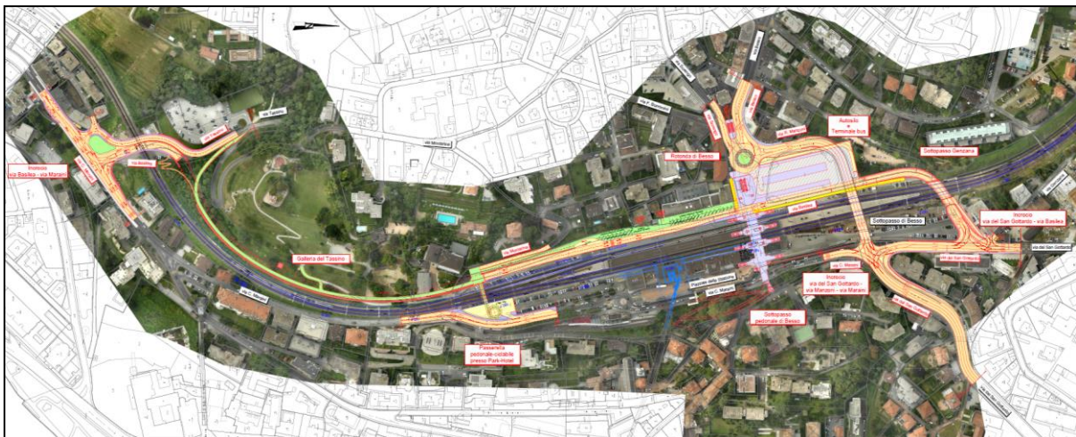
Planimetria progetto di massima

Committente: Cantone Ticino, Dipartimento del Territorio, Divisione delle Costruzioni, con FFS e Città di Lugano