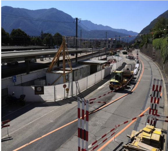
Cantiere Via Basilea