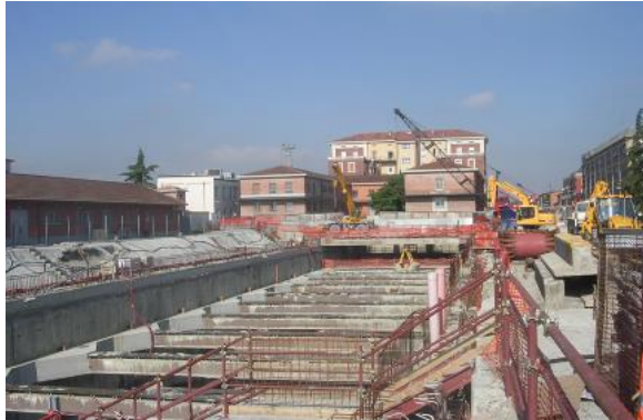
Lotto 5: Attraversamento edifici RFI e Corso Matteotti