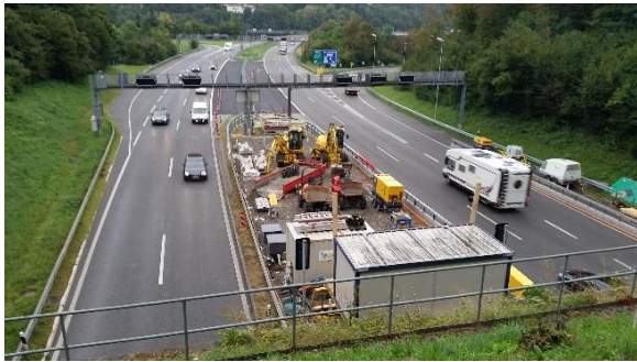
Esecuzione interventi di genio civile presso il portale nord della Galleria di Gentilino