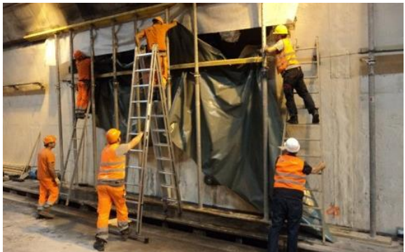
Galleria Melide-Grancia: primi interventi dopo dissesto del 08.06.2017