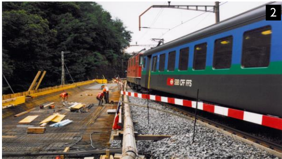
Risanamento Ponte FFS - Robasacco