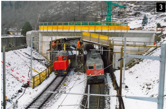
Ponte FFS Faido Ospedale - Faido