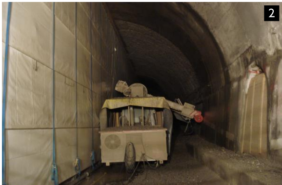
Galleria Monte Olimpino 2 - Como