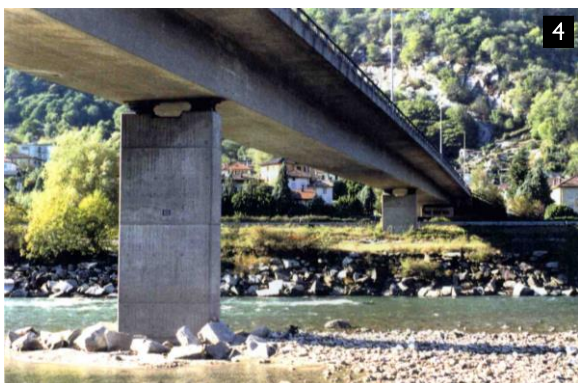
Ponte di Carasso - Bellinzona