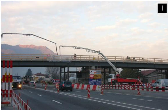
Ponte provvisorio su Strada Cantonale Lotto 751 - AlpTransit Nodo di Camorino

Committente: 1÷3 AlpTransit San Gottardo SA, Bellinzona 4 Cantone Ticino, Bellinzona