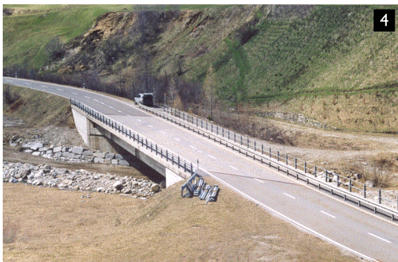
Risanamento Ponte - Villa Bedretto

Valore delle opere progettate: 1 CHF 3 Mio 2 CHF 45,5 Mio 3 CHF 13 Mio 4 CHF 2 Mio