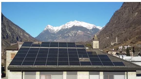
Falda Sud: situazione dopo posa