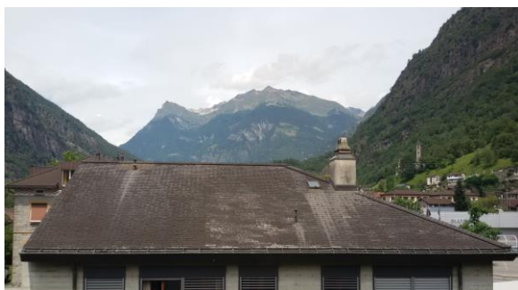
Falda Sud: situazione di partenza