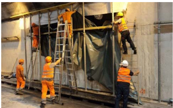
Galleria Melide-Grancia: primi interventi dopo dissesto del 08.06.2017

Committente: Ufficio Federale delle Strade, Filiale di Bellinzona