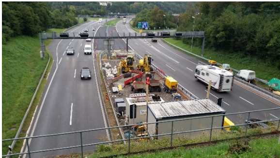
Esecuzione interventi di genio civile presso il portale nord della Galleria di Gentilino