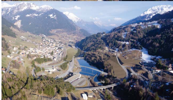
Riordino dello svincolo di Airolo: stato attuale (in alto) e stato di progetto (in basso) (Arch. G. Guscelli, Ambrì)