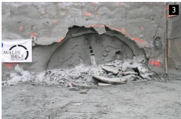
Fine scavo 1° canna - Marzo 2007

Committente: JV SNC Lavalin – SELI Canada Inc., Vancouver (Canada)