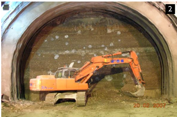
Lotto 8A: Sezione C2 - Fronte di scavo lato Milano