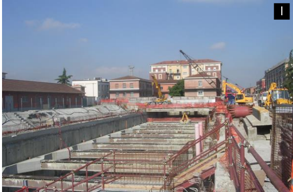
Lotto 5: Attraversamento edifici RFI e Corso Matteotti