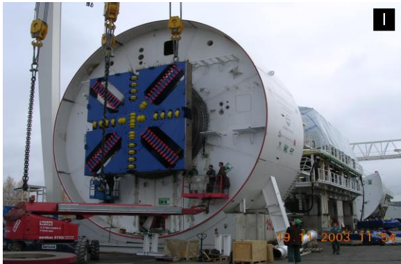
Collaudo Hydroshield c/o officine Herrenknecht AG

Committente: Herrenknecht AG, Schwanau (Germania)