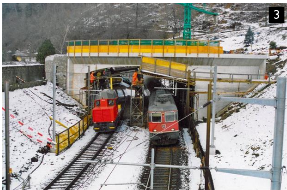
Ponte FFS Faido Ospedale - Faido