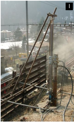
Muro di sostegno Ladro lungo FFS - Faido