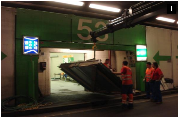
Galleria Stradale S. Gottardo - Porte rifugi

Committente: - Cantone Ticino, Dipartimento del Territorio, Divisione delle Costruzioni (CH) - Direzione d'Esercizio della Galleria Stradale del S. Gottardo, Cantoni Ticino e Uri, Airolo (CH) - Ufficio Federale delle Strade ASTRA, Filiale Zofingen (CH) - Diversi