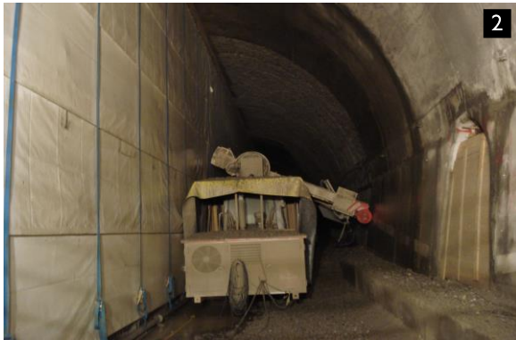
Galleria Monte Olimpino 2 - Como